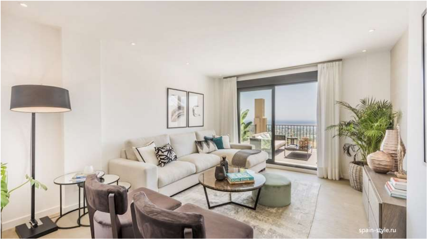
CENTRAL | 2 BEDROOM